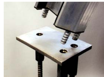
Ankerplatte mit Mittelstütze